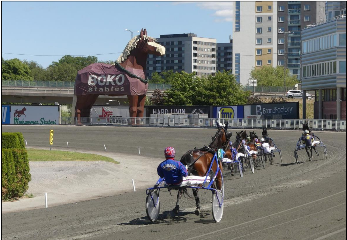
Das Feld im ersten Bogen.....