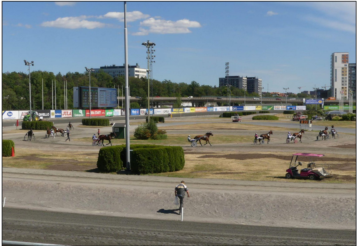
5 Minuten vor dem Start sammeln sich die Teilnehmer zur Parade.