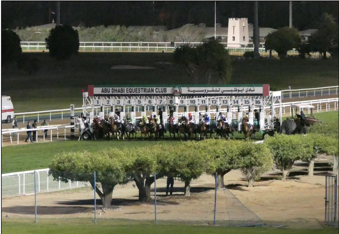
Start zu einer 2200m-Prüfung