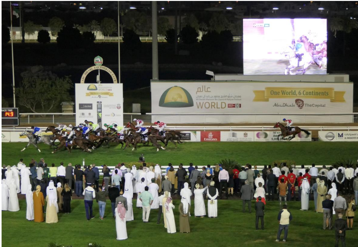
Nochmals in der Dunkelheit