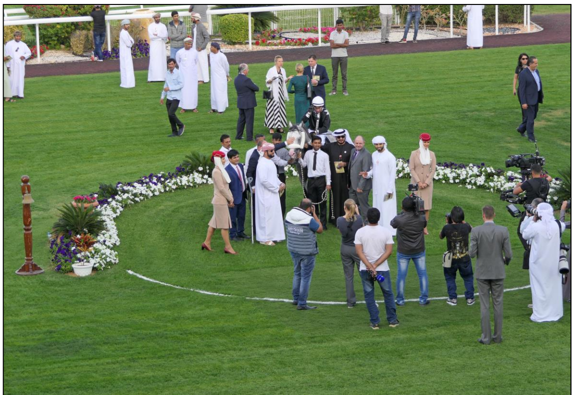
Der Sieger im Winner Circle