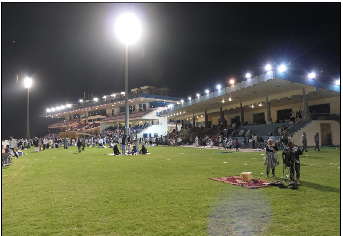
Die Tribünen vor dem letzten Rennen, sonntags ist der Publikumszuspruch deutlich geringer.