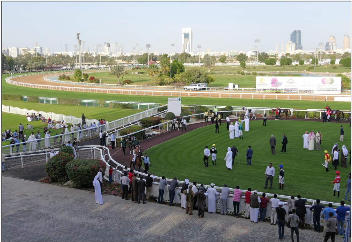
Impressionen aus dem Führing