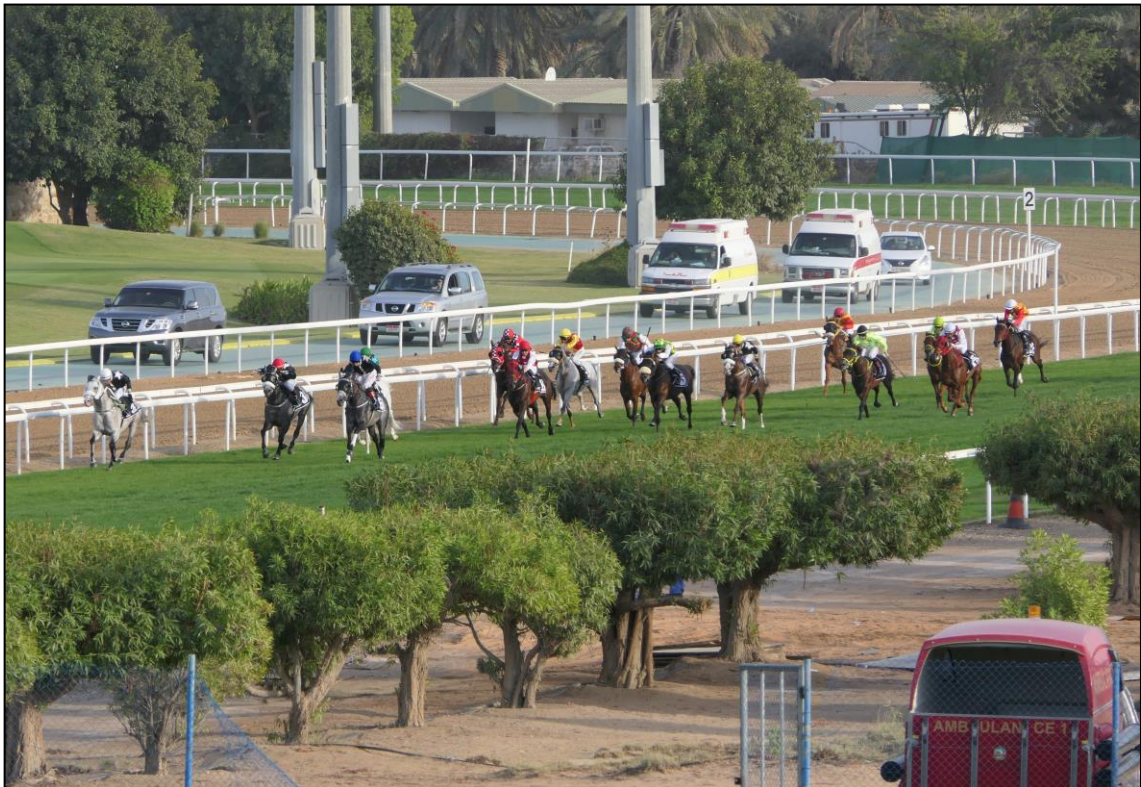
Das Feld im Einlauf.....