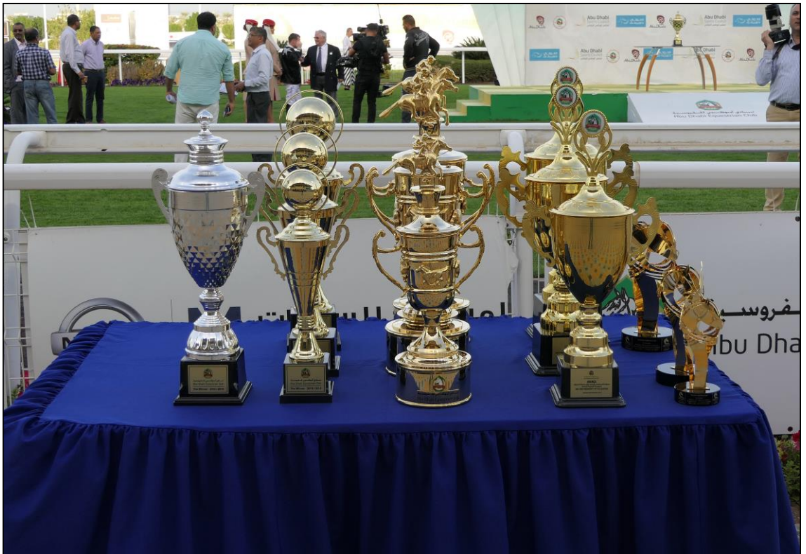
Auch an einem kleinen Renntag gibt es reichlich Pokale.