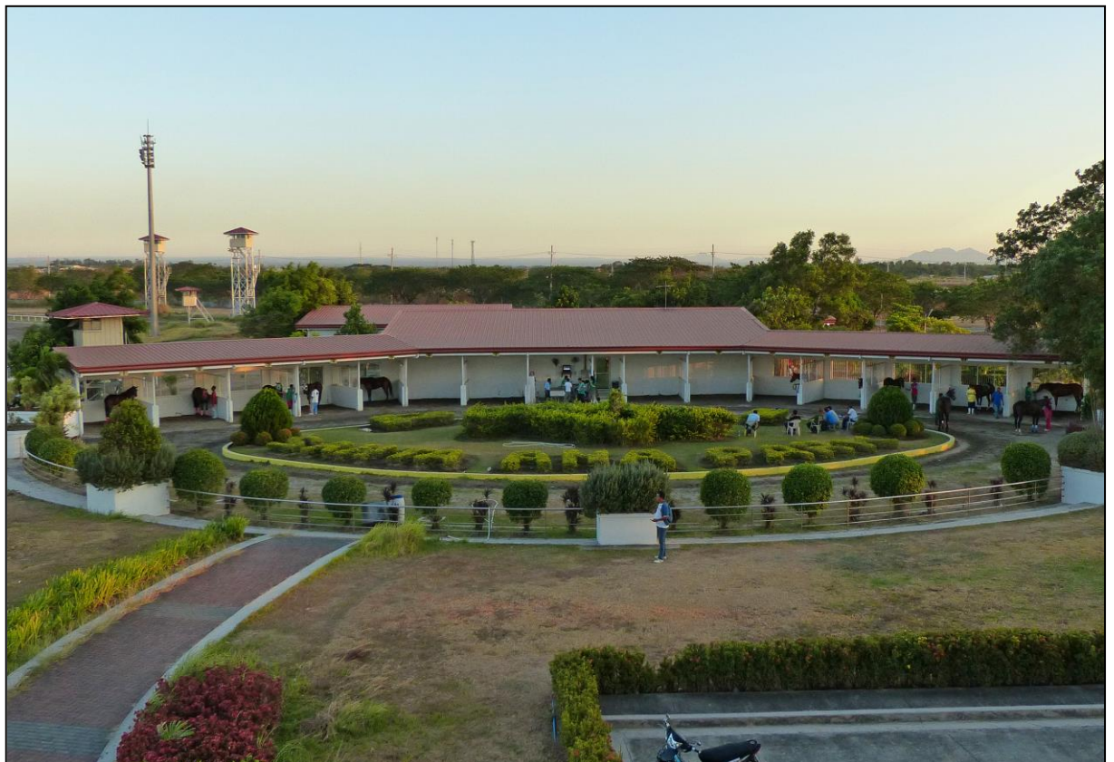
Sattelboxen und Führring. Auf dieser Bahn waren sie direkt zugänglich.