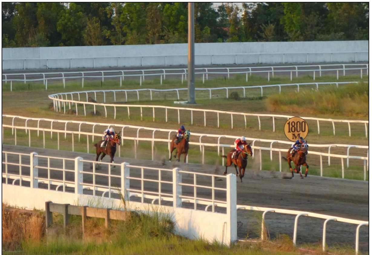
Das erste Rennen wurde noch bei Tageslicht ausgetragen. Das Feld Mitte der Zielgeraden und am Pfosten.