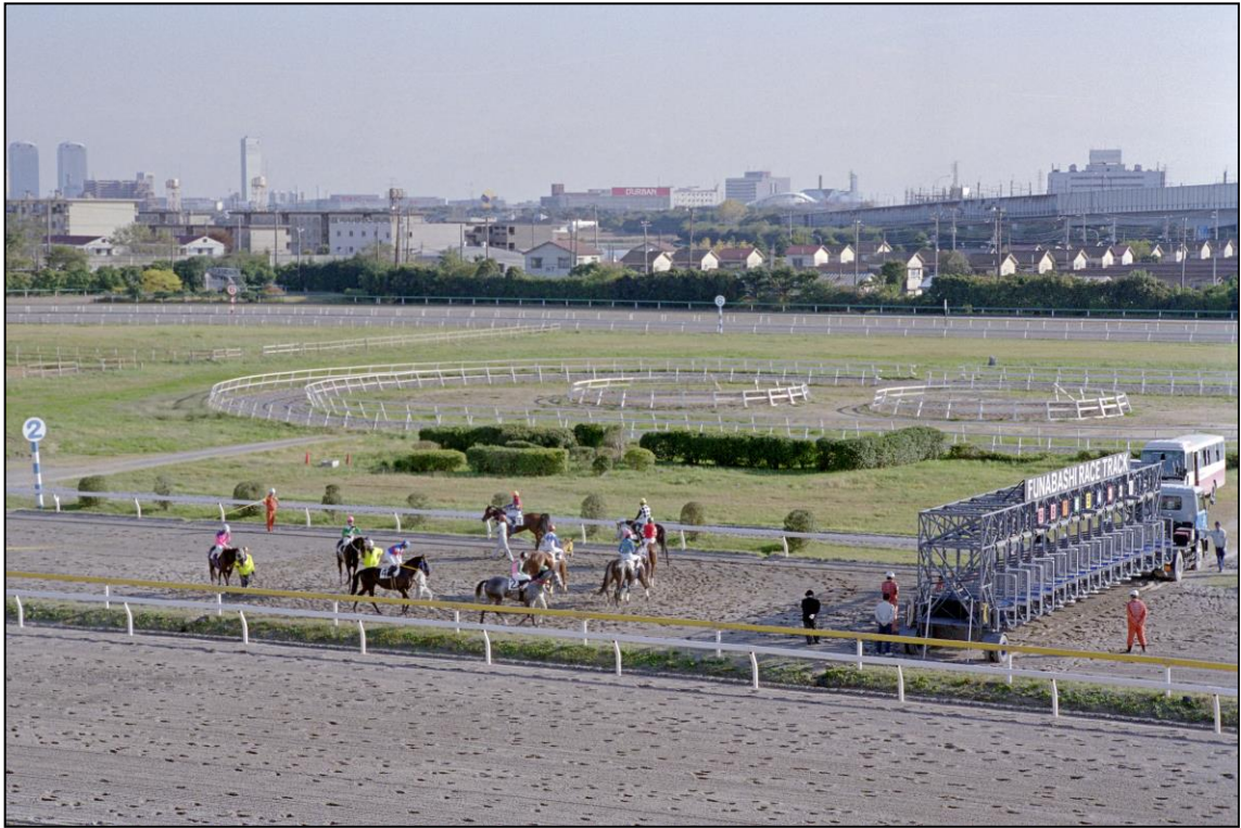
Das Feld am Start