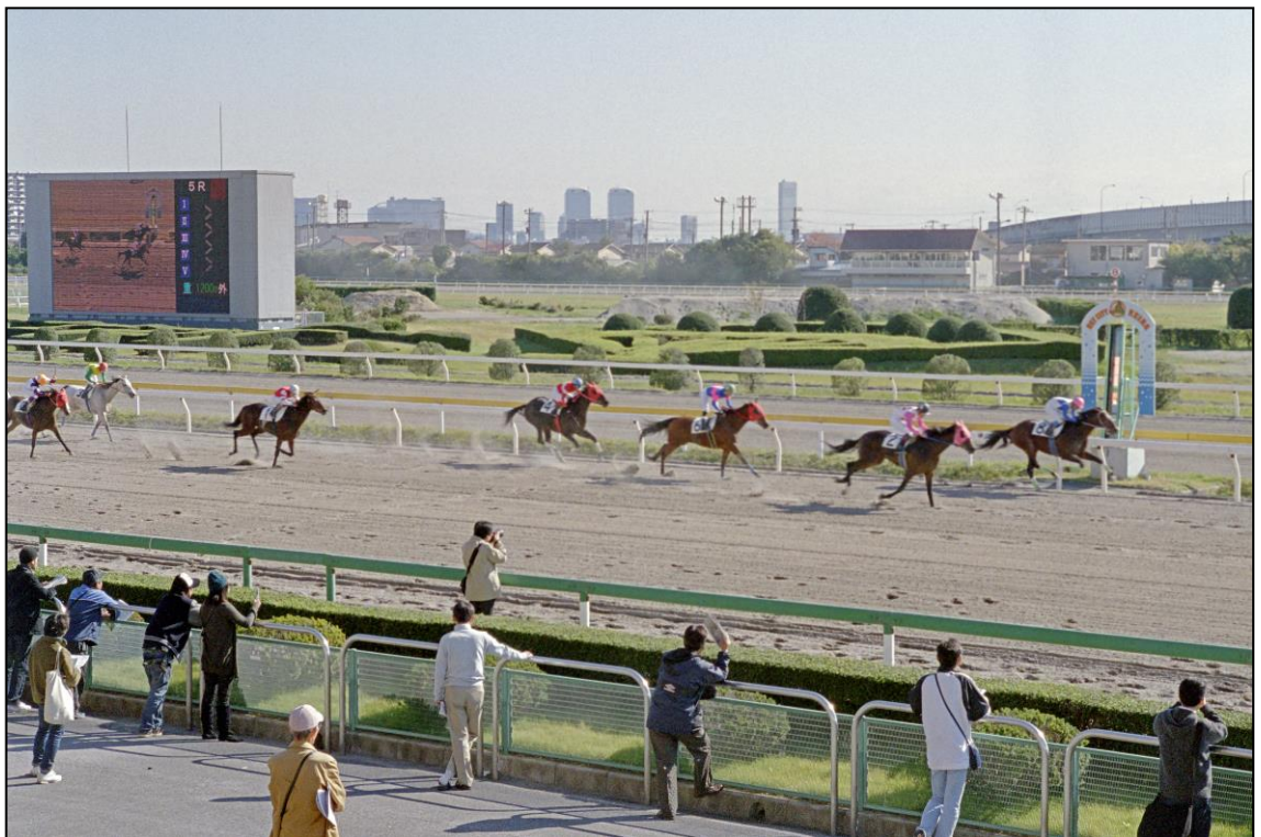
... und am Zielfosten