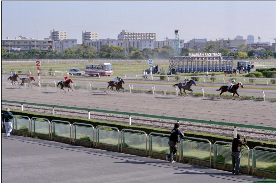
Die Pferde im Einlauf...