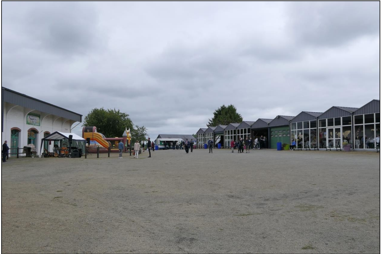
Zuschauerbereich hinter der Tribüne