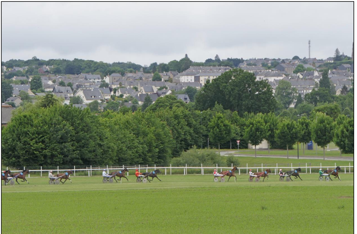
...weit auseinandergezogen in der Gegenseite...