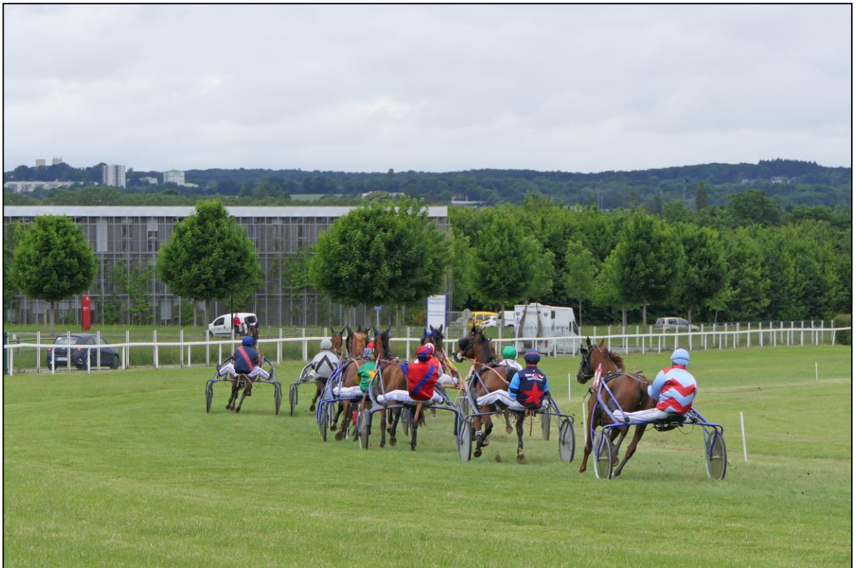
Das Feld im ersten Bogen...