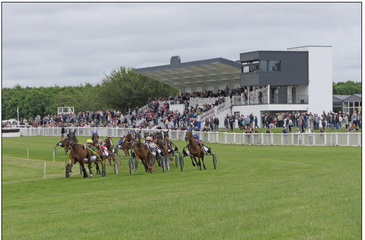
Nochmals der erste Bogen