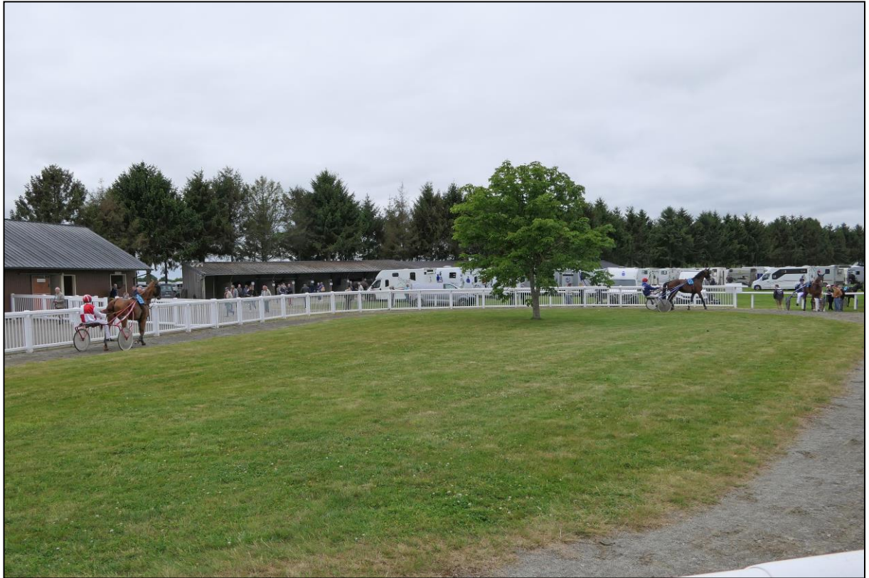
Die Traber im Führing