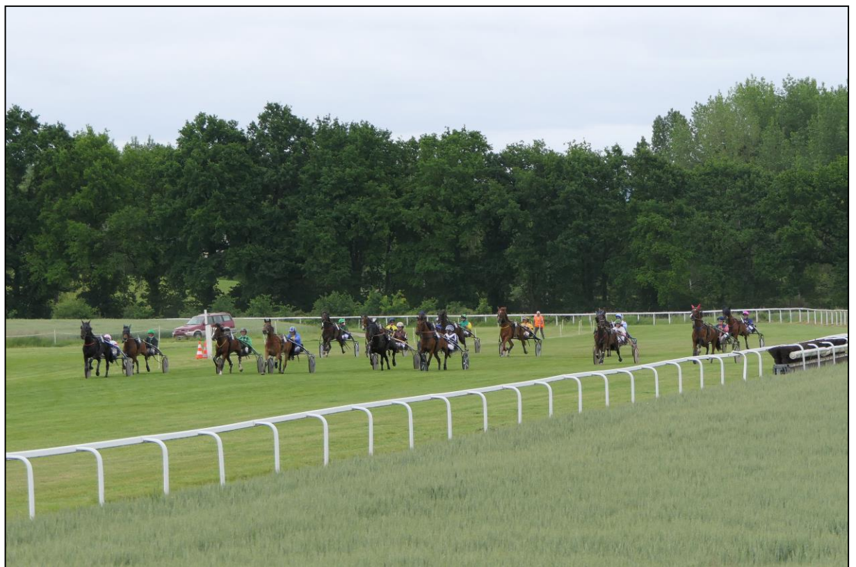
Das Feld nach dem Bänderstart