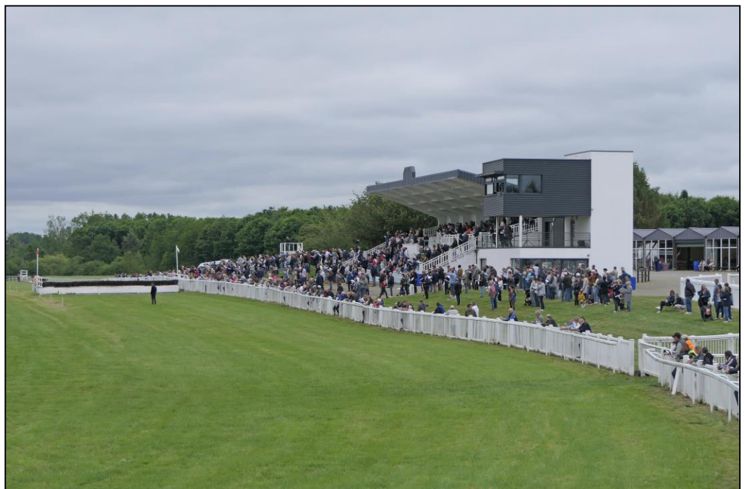
Tribüne und Richterturm