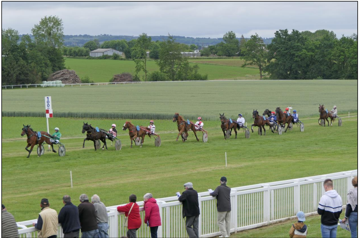
...und schließlich im Einlauf.