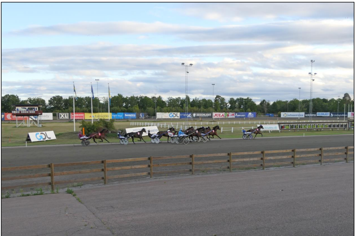
Szenen in der Zielgeraden