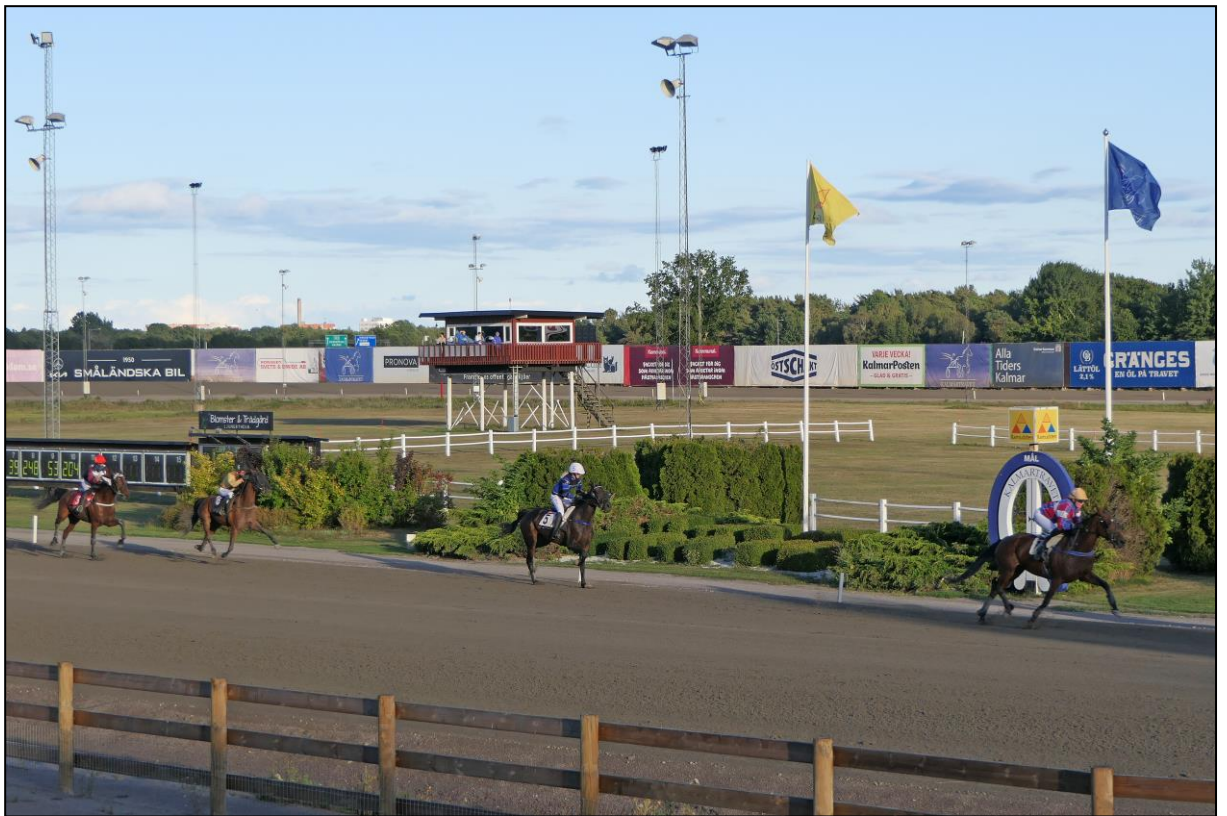
Zielankunft der Trabreiter