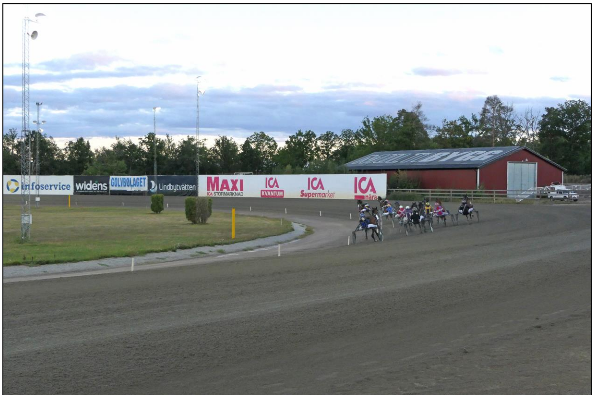
Das Feld im ersten Bogen...