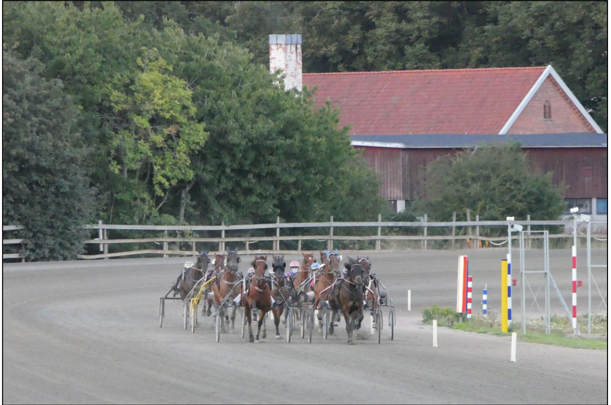
...und zu Beginn des Einlaufs