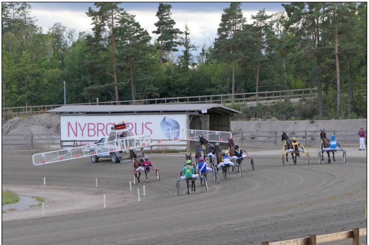
Das Startauto in Bewegung. In Schweden ist es üblich, dass der Flügel abgeknickt werden kann, um die überhöhten Kurven auszugleichen.