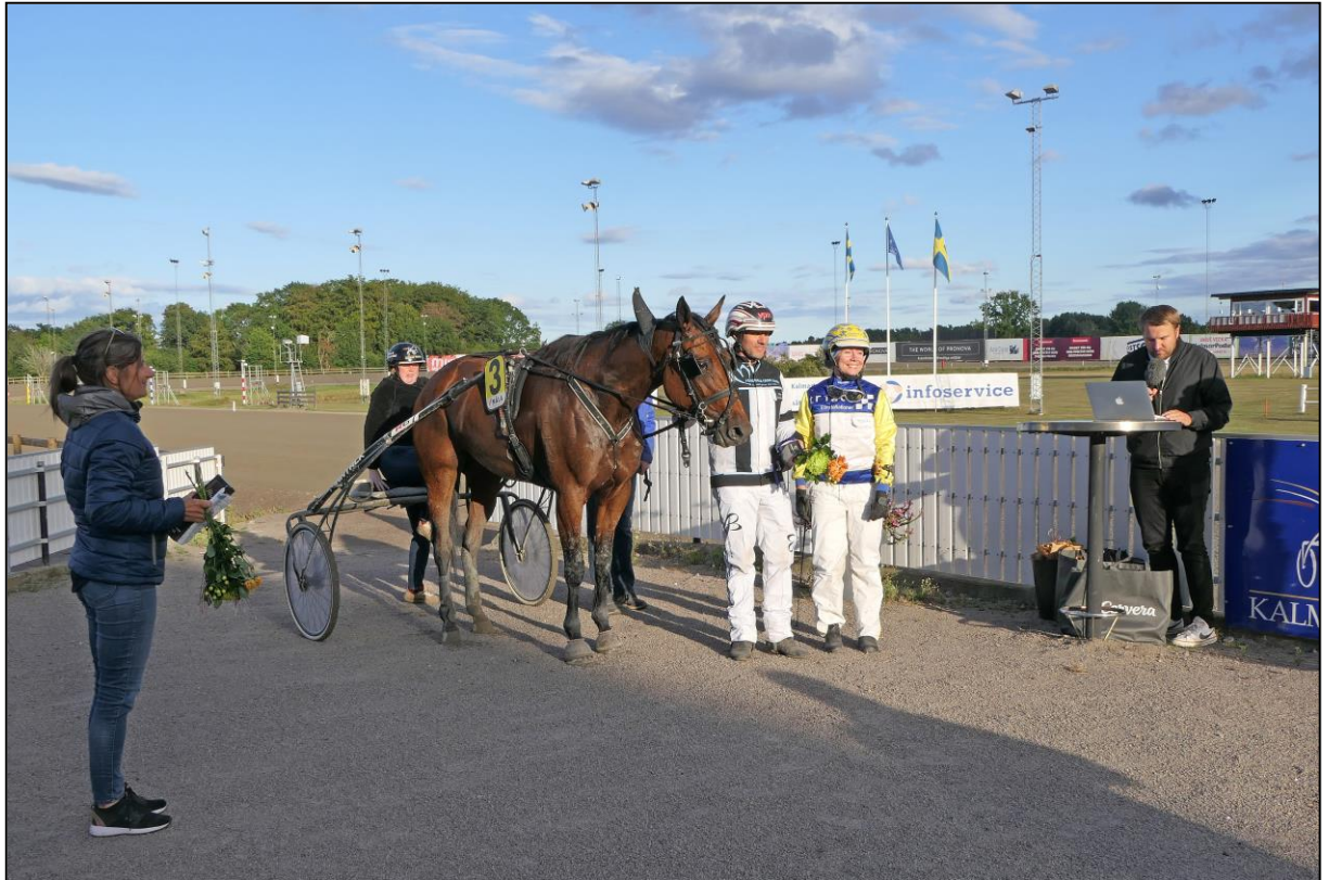
Als Sieger gibt es einen Blumenstrauß...