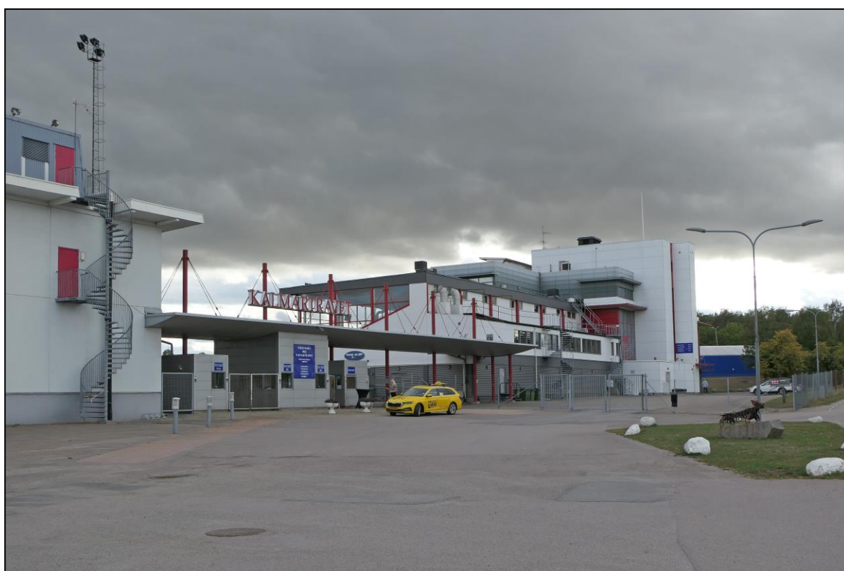
Tribünen-Rückseite und Eingang

Keine 100 Zuschauer, das scheint bei werktäglichen Abendveranstaltungen und mäßigem Wetter fast schon die Norm zu sein in Schweden. Es hatte kein Wettschalter geöffnet, eine freundliche Dame war beim Wetten über das Smartphone behilflich. Gastronomie: ein Stand unter der Tribüne.