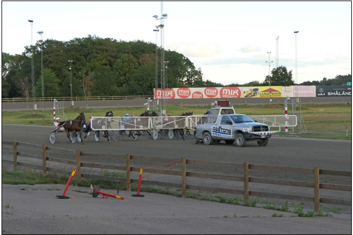
An der Startstelle