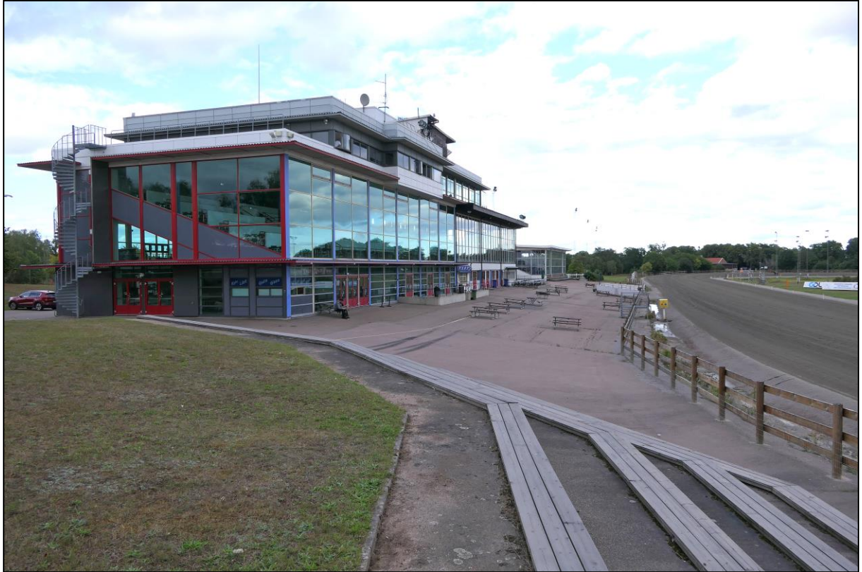
Tribünen, die oberen Etagen blieben geschlossen.