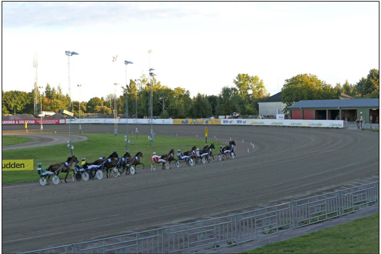
Das Feld im ersten Bogen...