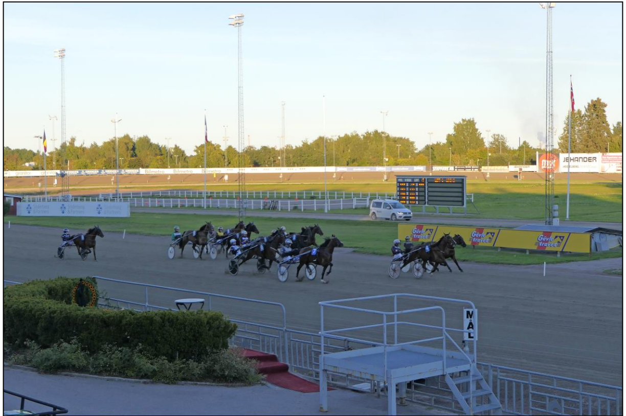
Die Pferde kurz vor der Linie