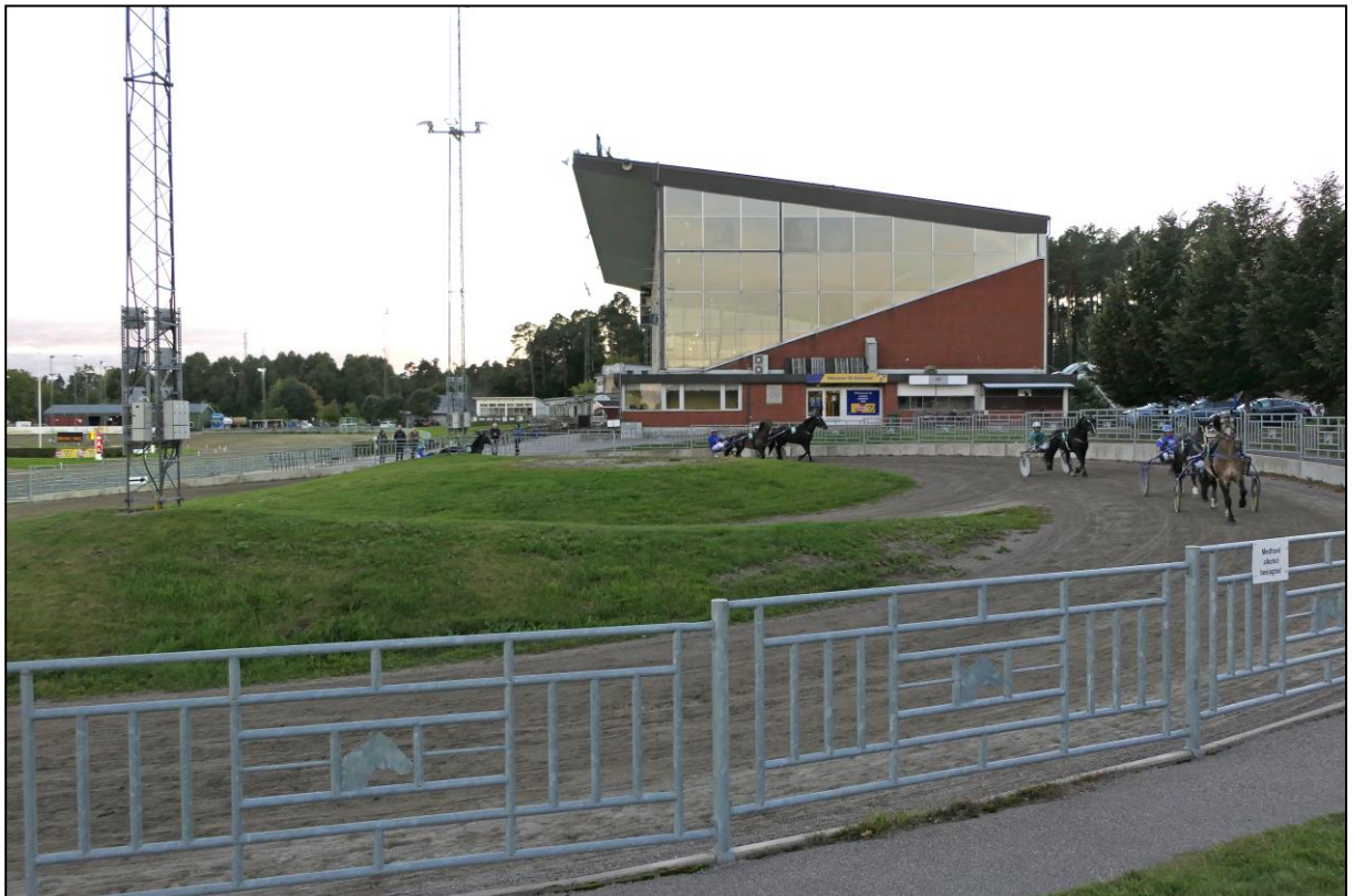
Hier gibt es sogar einen Führring, in dem sich die Teilnehmer sammeln,...