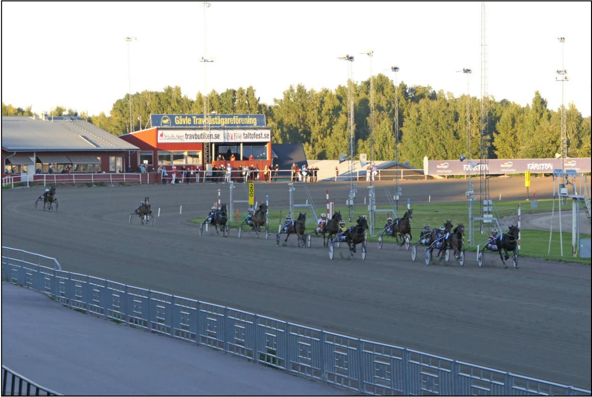
Der Endkampf ist in vollem Gange