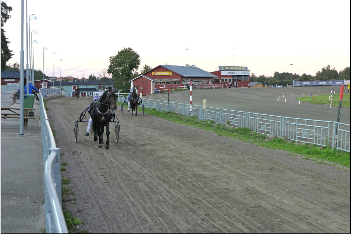
Die Gespanne kommen aus dem Stallbereich