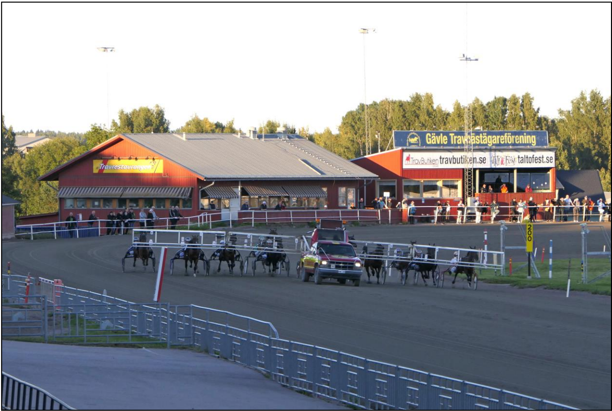
Das Startauto in Aktion