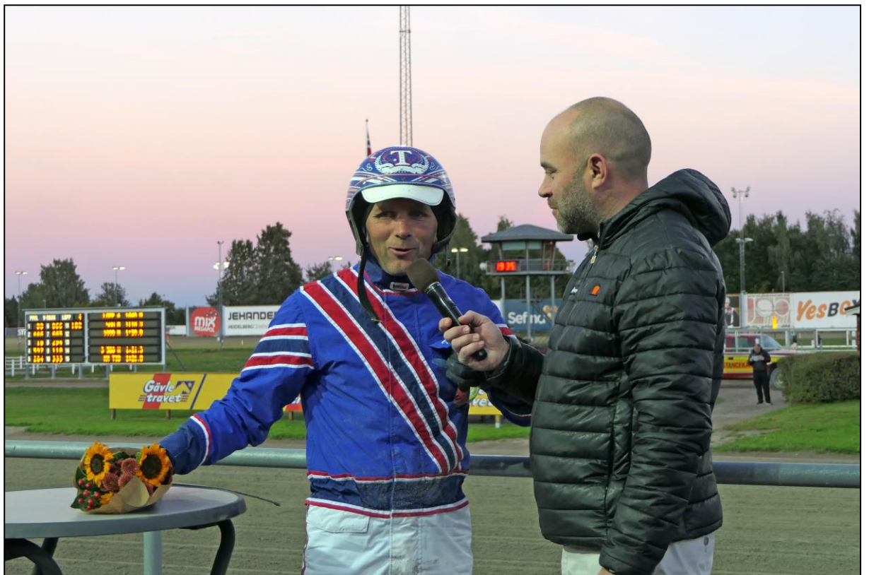
Blumenstrauß und Siegerinterview sind obligatorisch.