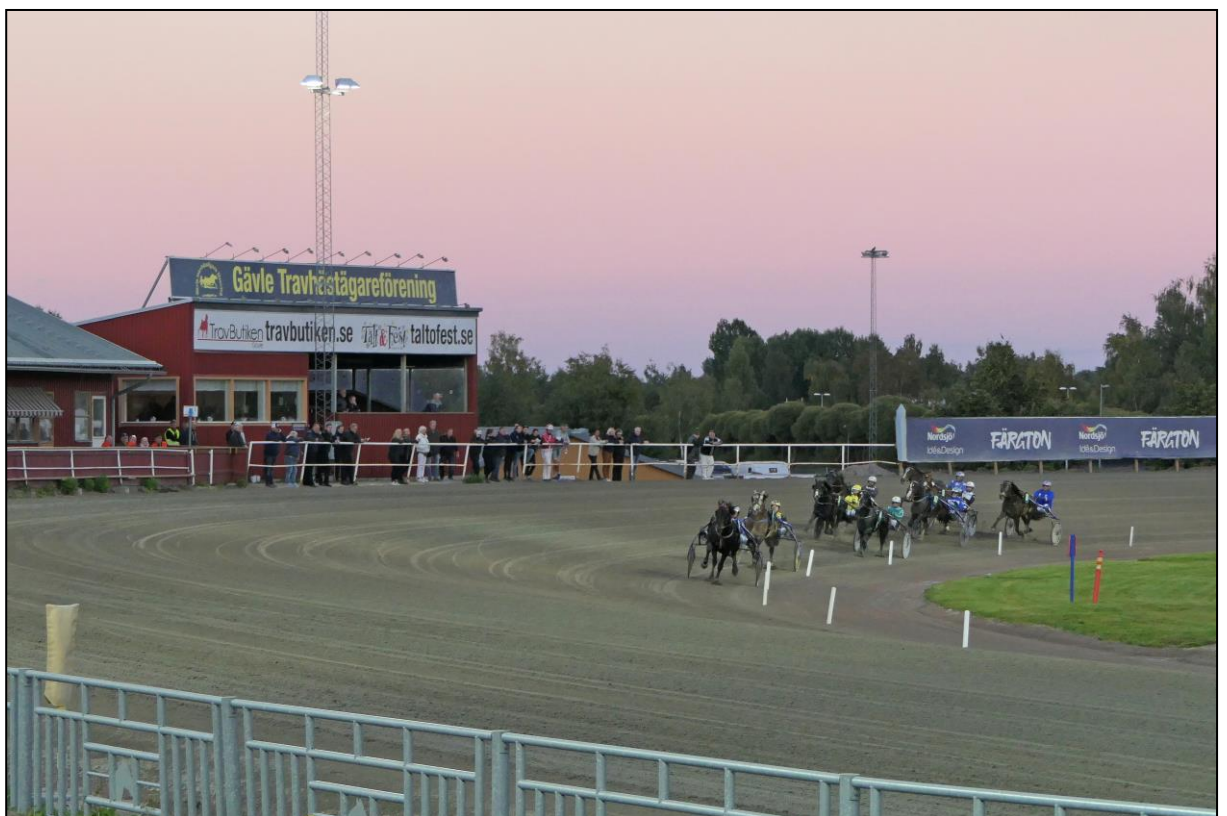
... und kurz vor dem Einbiegen in die Zielgerade