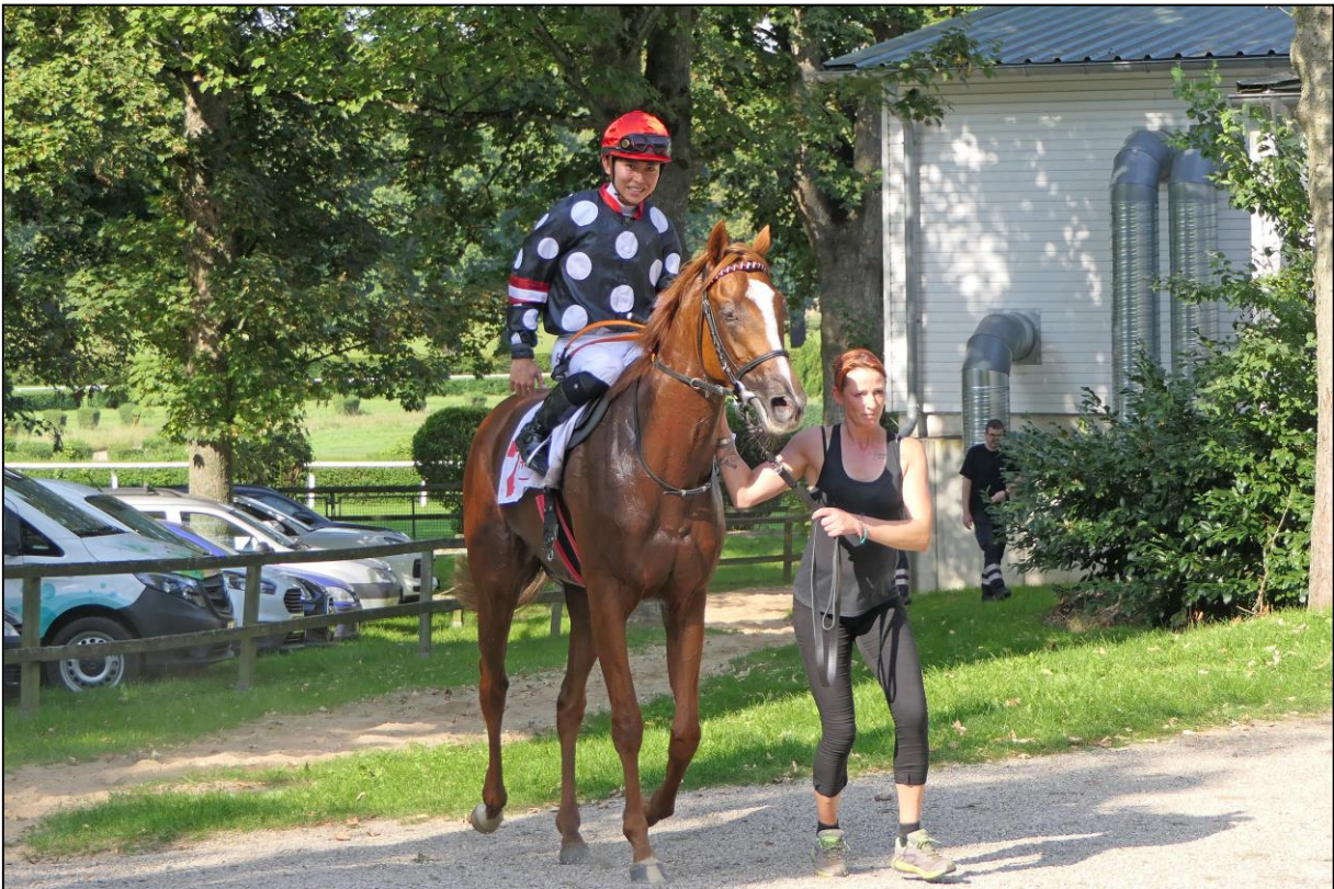
Auf dem Weg zum Absattelring