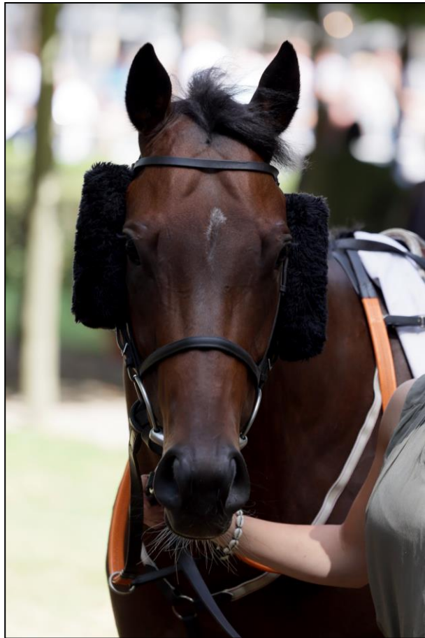
My Motivate Girl