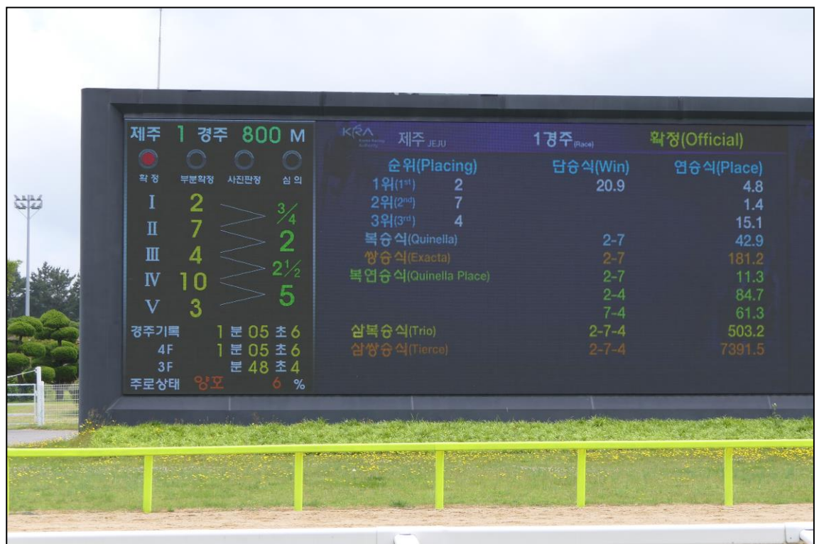
Die beeindruckende Videowand zeigt den Einlauf, die Abstände zwischen den Pferden und die Quoten an. In allen Rennen werden stets diese Wettarten angeboten: Sieg, Platz, Quinella / Exacta (die beiden Erstplatzierten in beliebiger / richtiger Reihenfolge), Quinella Place (Platzzwilling) sowie Trio / Tierce (die drei Erstplatzierten in beliebiger / richtiger Reihenfolge). Viererwette oder diverse V-Wetten sind in Korea unbekannt.