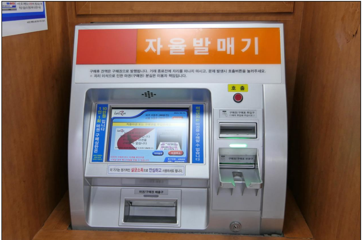
Wettautomat. Es gibt nur wenige manuell besetzte Schalter.