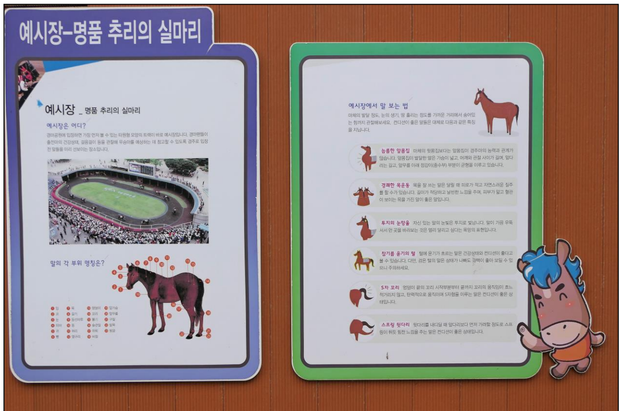
Mit diesen Schildern am Führung werden Körperbau und Verhaltensweisen des Pferdes erklärt.