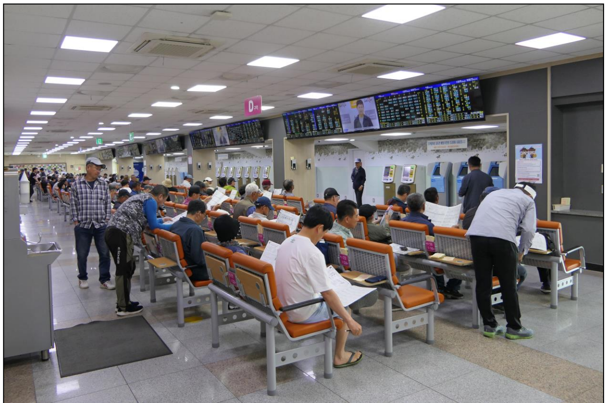
Innen dominieren Stühle mit Klapptisch und unzählige Monitore, auf denen die Eventualquoten aller Wettarten angezeigt werden.