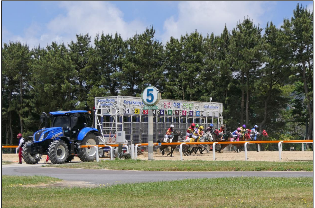
Nach Öffnen der Boxen