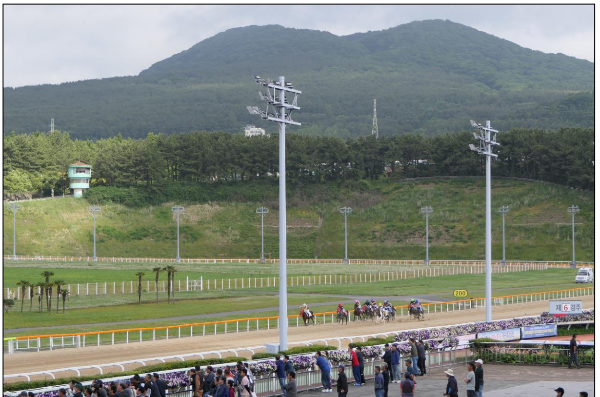
Das Feld im Einlauf