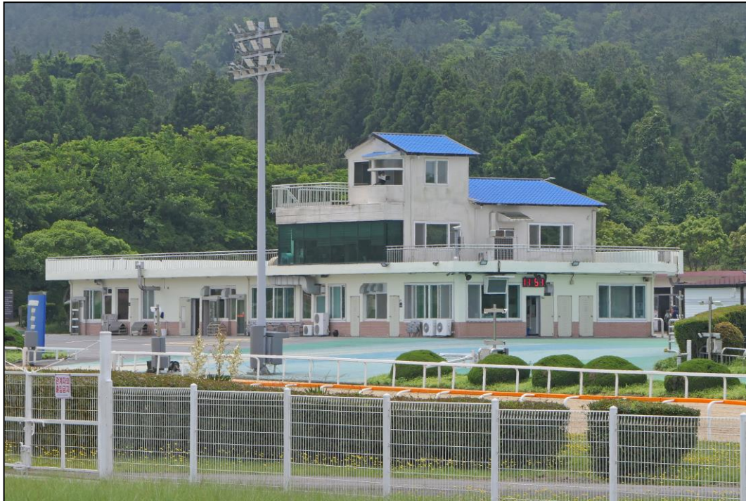
Waagegebäude. Wie in Japan, so werden auch hier die Reiter vom Publikum streng abgeschirmt.