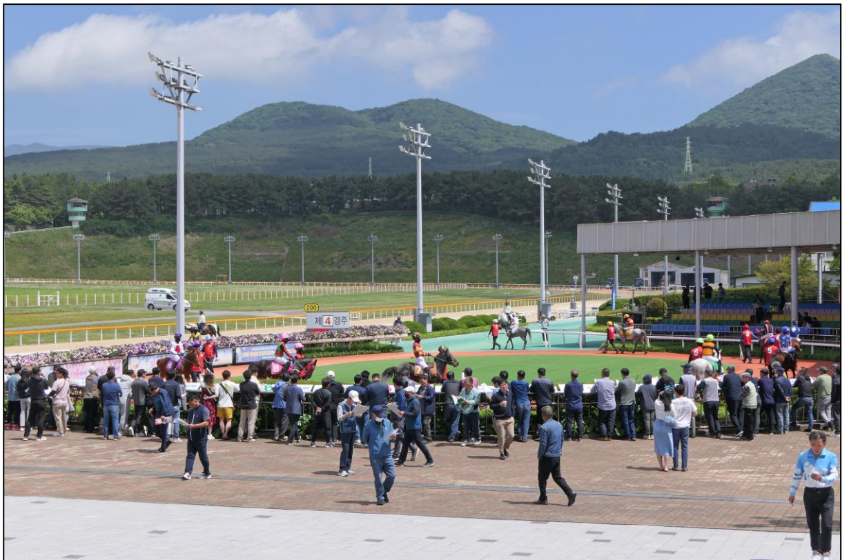
Eindrücke vom Führring