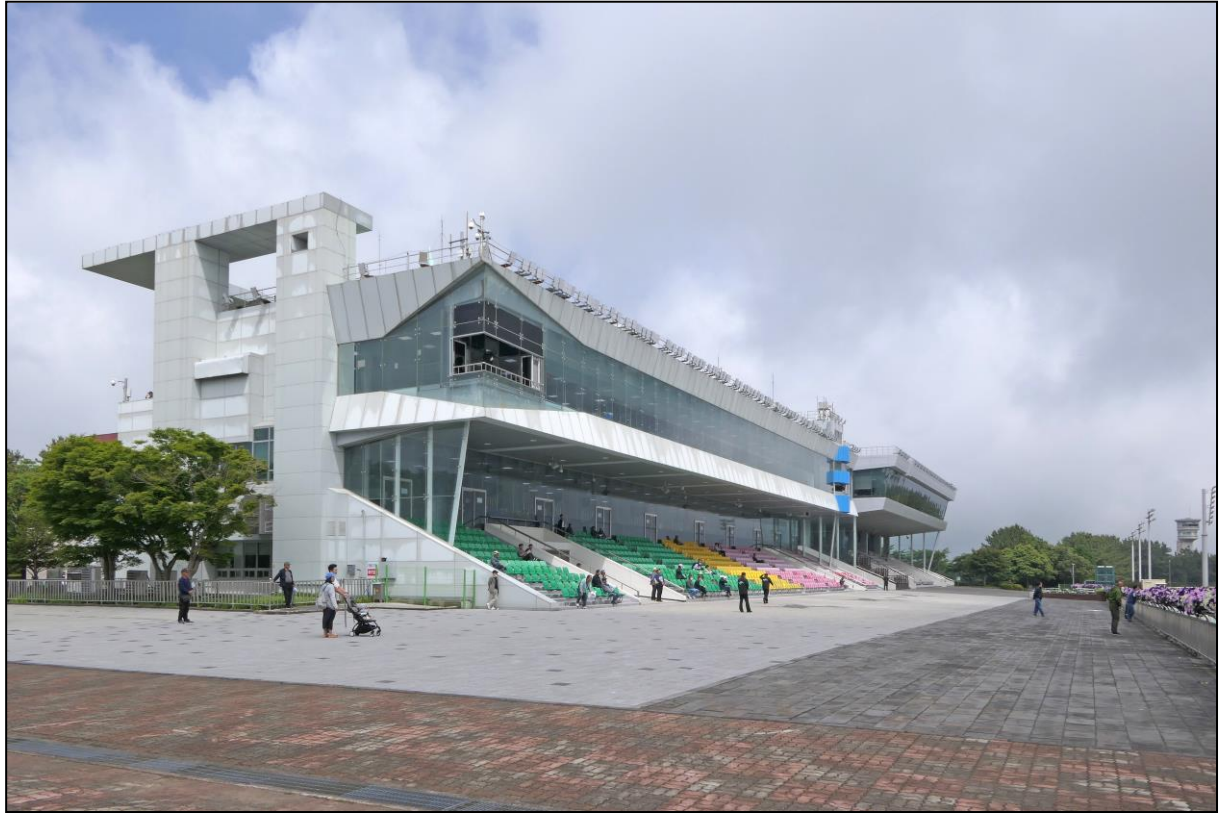
Die beiden Tribünen, verglast und klimatisiert