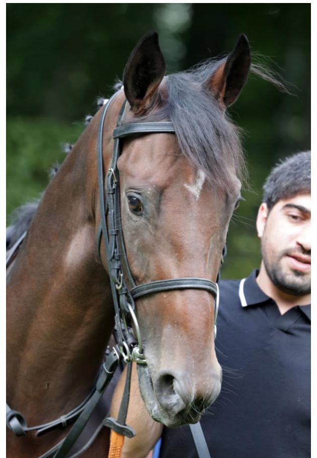
Like a Hurricane