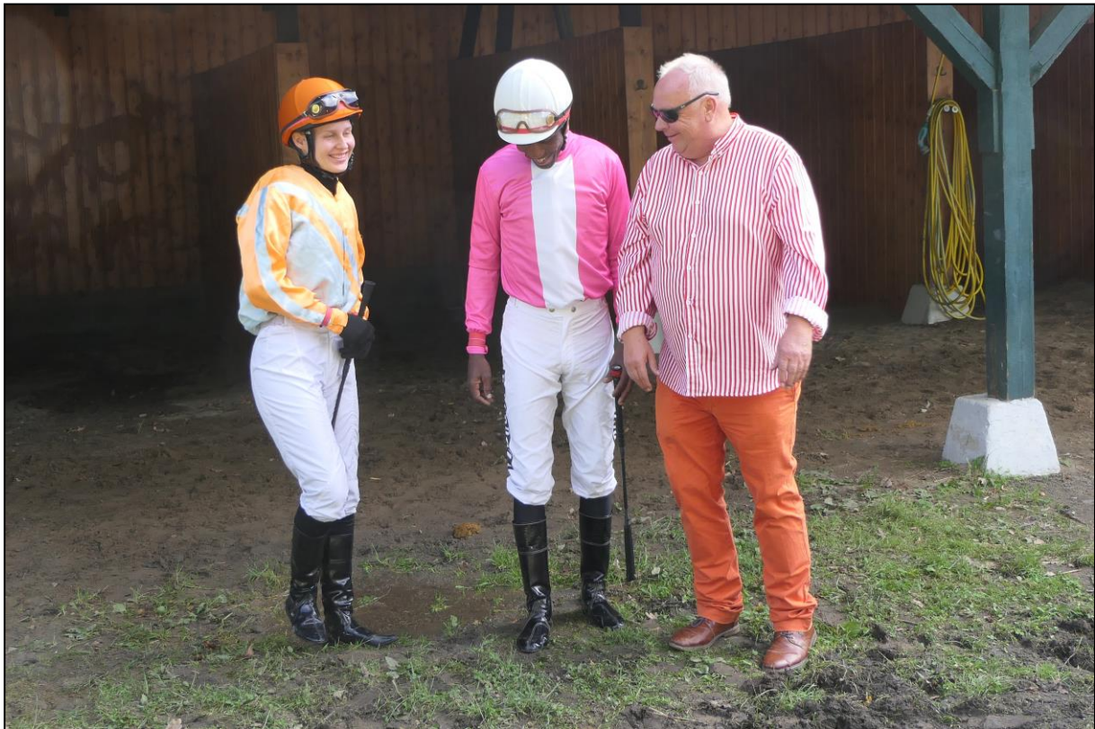
Auf der Zielgeraden