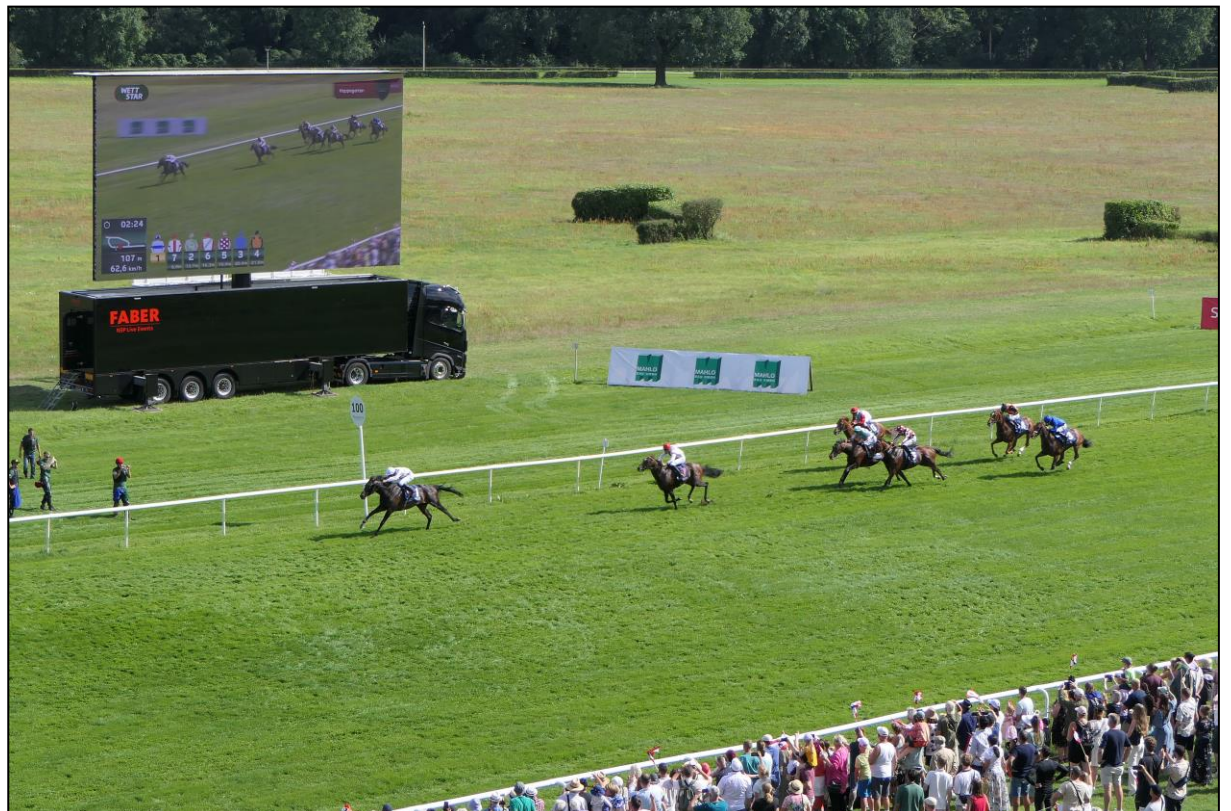
Der Vorsprung vergrößert sich mit jedem Galoppsprung und .....