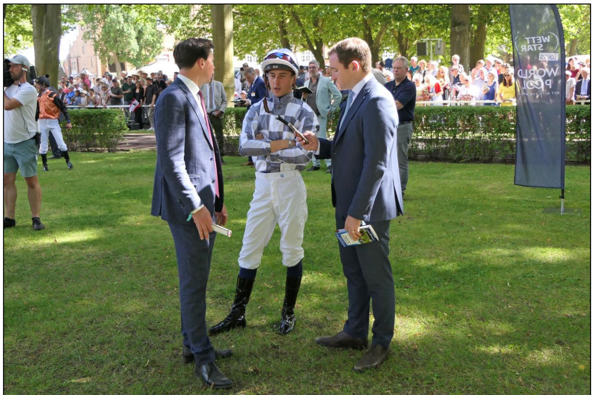
Die Reitorder kommt von Trainer Joseph Patrick O'Brien, dem Sohn des hocherfolgreichen Trainers Aidan O'Brien.