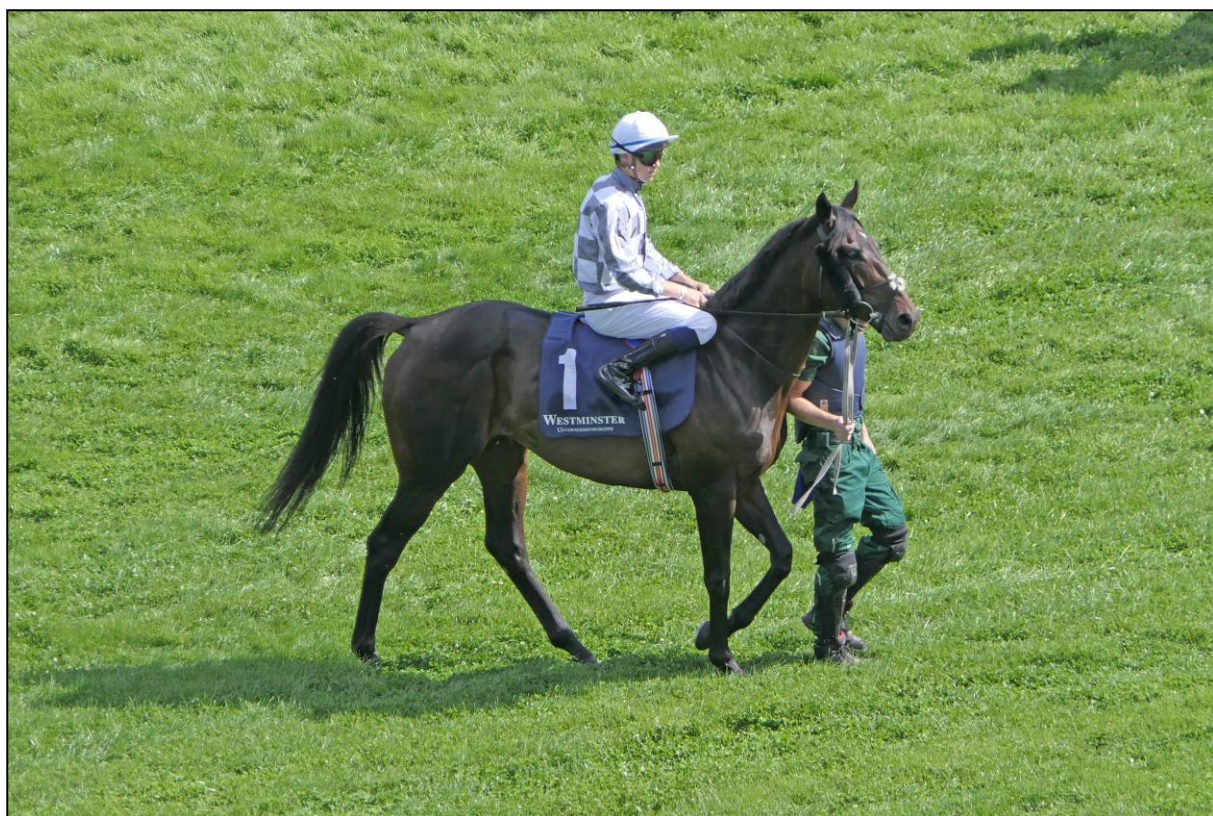
Auf dem Weg in die Startbox