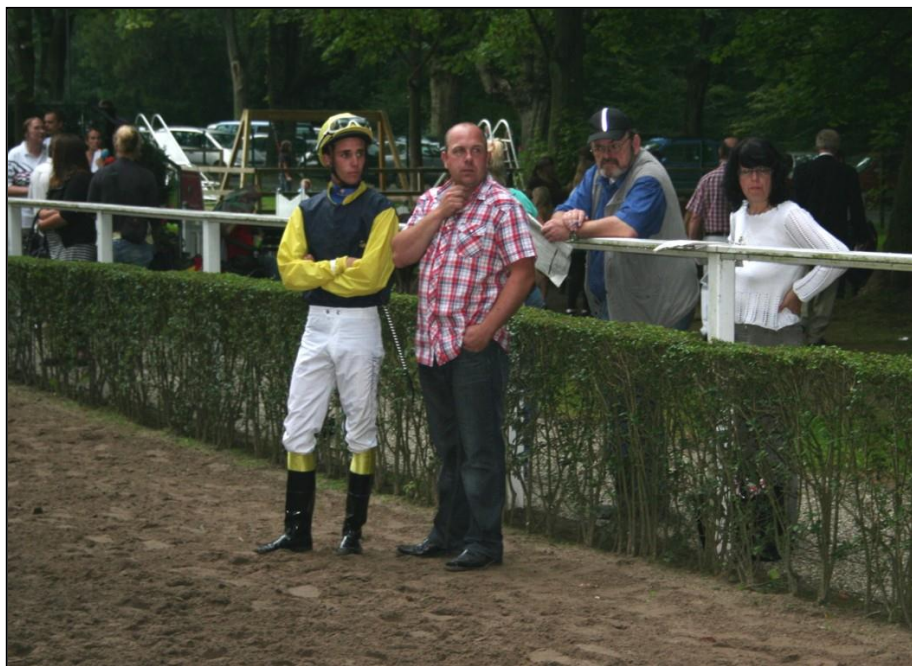
Nice Land ist ein etwas schwieriges Pferd. Trainer und Reiter Überlegen, was zu tun ist.