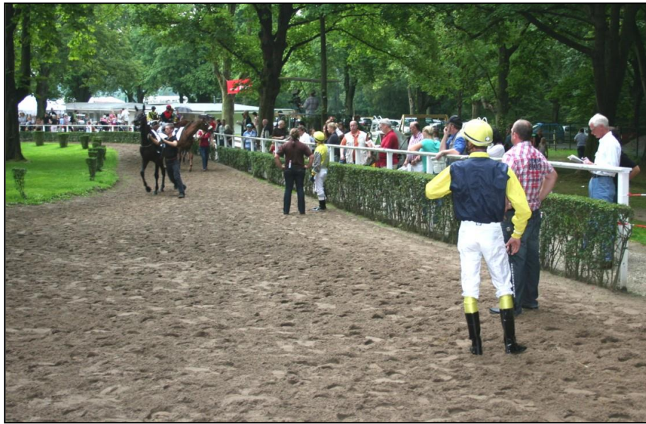
Warten auf Nice Land